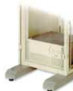
Вариант размещения ИБП Smart-UPS 2200RM13U и 3000RM13U