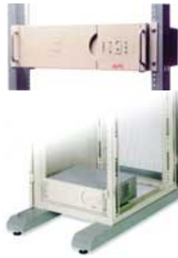
Варианты размещения ИБП Smart-UPS RM

Источники бесперебойного питания (ИБП) серии Smart-UPS RM созданы с применением наиболее эффективных и современных технологий. Механизм управления батареями повышает их надежность и увеличивает продолжительность работы. В гнездо расширения SmartSlot можно устанавливать дополнительные платы для настройки и расширения функций Smart-UPS. Smart-UPS – это совершенные ИБП для файл-серверов, мини-компьютеров, систем UNIX, узлов межсетевой связи, телекоммуникационных систем и других жизненно важных устройств. ИБП защищают данные от сбоев в сети путем подачи резервного питания на устройства. При наличии дополнительного программного обеспечения или средств наблюдения Smart-UPS надежно защитит данные, корректно и своевременно проведет закрытие персональной или сетевой ОС до полной разрядки батарей. Функции SmartBoost и SmartTrim предназначены для осуществления автоматической коррекции напряжения при его повышении или понижении, позволяя работать в условиях кратковременных сбоев без использования энергии батареи. Имеется также модификация модели в новой плоской конструкции для монтирования в стойке – серия Smart-UPS RM. Она предназначена для серверов, коммутаторов, других устройств со стоечным монтажом и сочетает все преимущества серии Smart-UPS и удобство монтажа.